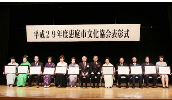
・平成29年度受賞者の皆さん(H29.11.25)