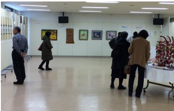
多彩な作品が来場者の目を楽しませました