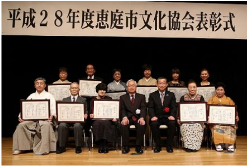
・平成28年度受賞者の皆さん(H28.11.19)