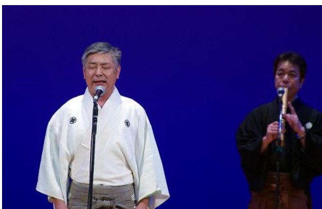
管内郷土芸術祭 恵庭民謡連盟