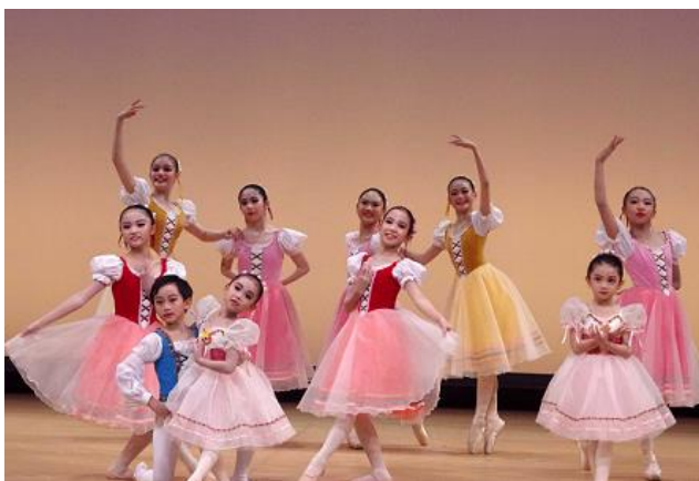
管内郷土芸術祭 ビジューバレエコンチェルト