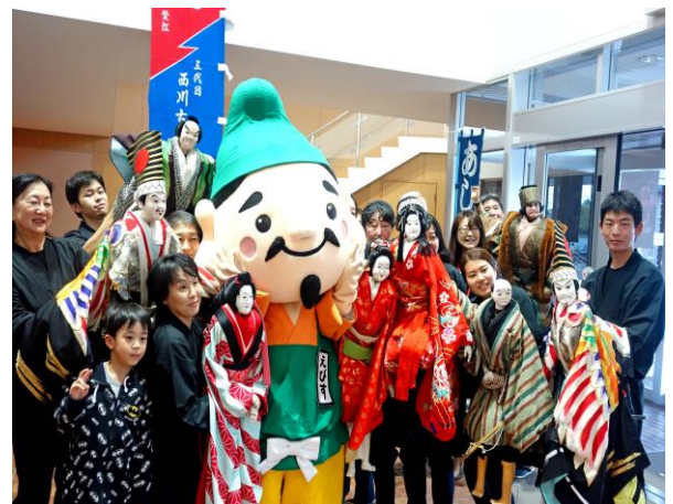
人形浄瑠璃公演終了後、特別出演したえびす君もお客様をお見送り

昔も今も、文化活動が日々暮らしていく自分の心と地域社会に「はりあい」と「いきがい」をもたらしてくれるのは同じです。「手づくりの文化」の輪を更に広げて、恵庭をもっともっと文化の豊かな町にしていこうではありませんか。このたび、文化協会のホームページ開設を計画しました。まだ作業途中ですが、これで、誰もが恵庭の文化協会にアクセスできるようになります。パソコンなど無縁の方もおられるでしょうが、社会はインターネットで繋がっています。自分の好きな時に、恵庭の文化情報を閲覧できるようになります。開かれた協会のイメージを持って貰えることで、新たな展開があることを期待しています。新年度もみんな仲良く、恵庭の文化発展に力を合わせていきましょう。