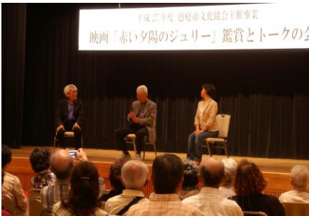
＜上映前のトークショー＞

6月18日、市民会館中ホールを会場に、旧穂別町の高齢者の皆さんが企画制作した映画「夕陽のジュリー」