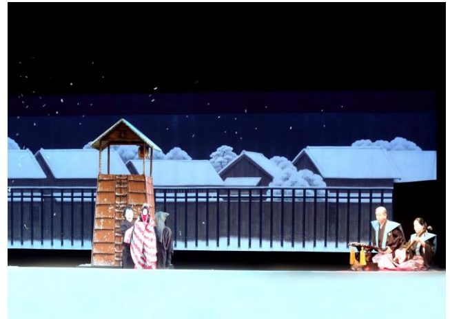
＜恵庭で初めての人形浄瑠璃芝居＞

ちなみにチケット販売枚数は402枚で、このうち74枚はプレイガイドでの売り上げ。これは非会員の一般市民の購入ということになります。