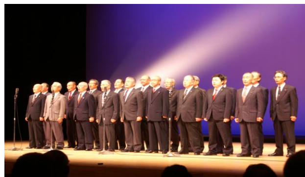
<日本詩吟学院 北海道樽前岳風会 恵庭支部>