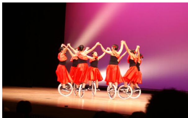
<柏小一輪車クラブ（一般）>