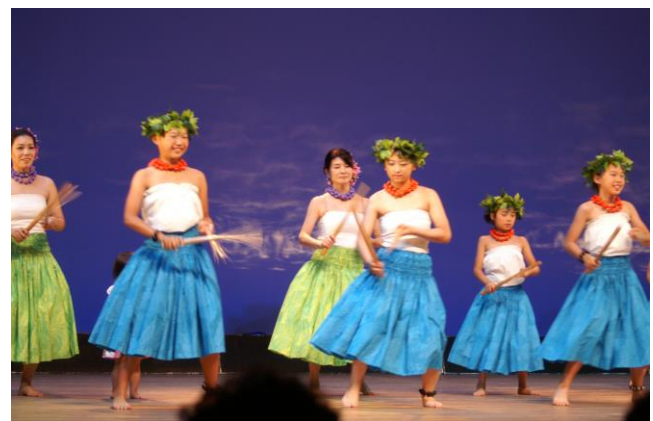
＜江別市民文化ホール フラストスタジオモアナ＞

平成27年度の管内郷土芸術祭は、文芸部門が6月28日北広島市(参加/市民文芸の会)、舞台発表は8月30日江別市民文化ホールで(出演/クラウン歌謡学院恵庭、フラスタジオモアナ)、展示発表は11月21・22日千歳市民ギャラリー(出品/美術協会、陶芸サークル響香、写真協会、華道協会、書道連盟)でそれぞれ開催されました。