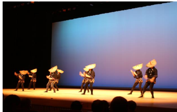
<富山県人会 えにわ越中おわら風の盆踊り会>