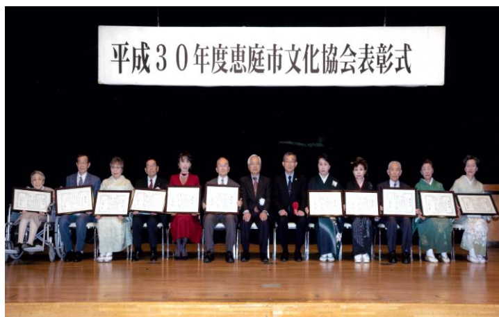
平成 30 年度受賞者の皆さん (H30.12.1)