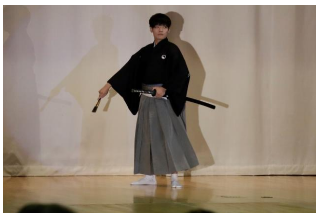
管内郷土芸術祭で発表する吟舞・國風流詩吟吟舞会