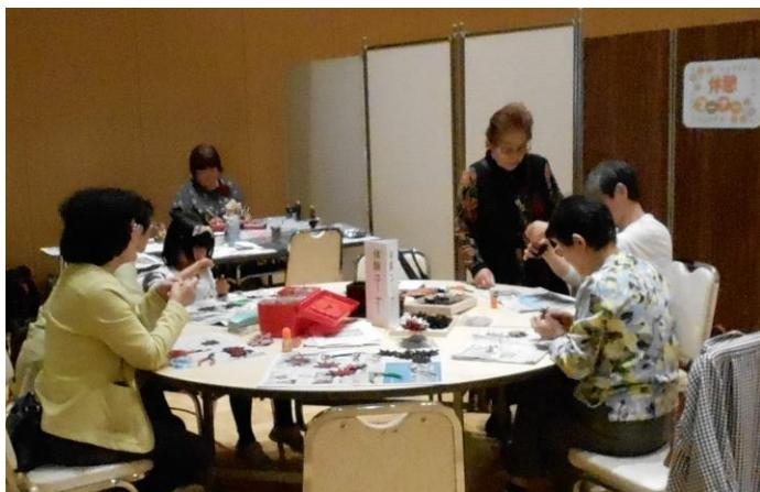
恵庭展示会場で開催したレザークラフト体験コーナー

2 会場合わせての展示入場者は前年比 590 人の増、舞台入場者は前年比 267 人増でした。出品・出演者の微減の中で、観客が増加したことは皆様の頑張りのお蔭とっております。