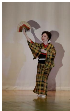
管内郷土芸術祭で発表する日舞・西崎流緑森会